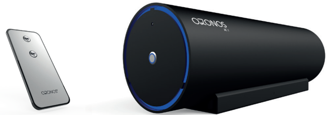
Abbildung 1: Remote Control